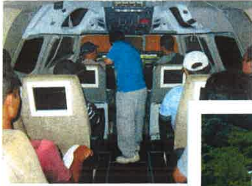
←シミュレーター体験

がつ 18 日 (月) 成田航空博物館 & 成田空港 に行ってきました。 ひこうき みて ちゅうしょく きないしょく たべました たくさんの飛行機を見て、昼食は機内食を食べました。