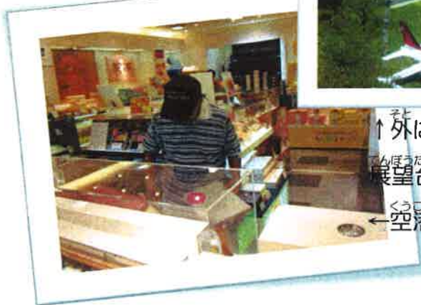
↑外にはセスナなど展示してありました。 展望台からは空港がよく見えました。→