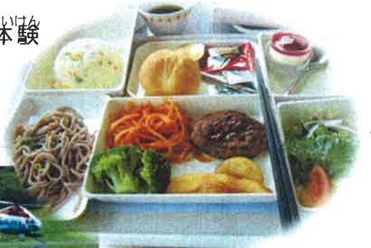
きないしょく 機内食 →